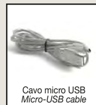
Cavo micro USB Micro-USB cable