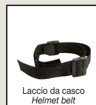
Laccio da casco Helmet belt