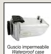
Guscio impermeabile Waterproof case