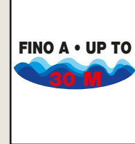
FINO A • UP TO 30 M