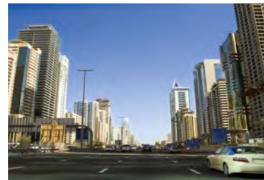
Angolo di visione / View angle 140°