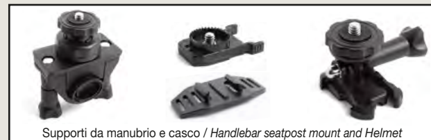
Supporti da manubrio e casco / Handlebar seatpost mount and Helmet