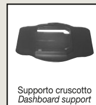
Supporto cruscotto Dashboard support