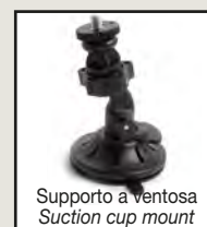
Supporto a ventosa Suction cup mount