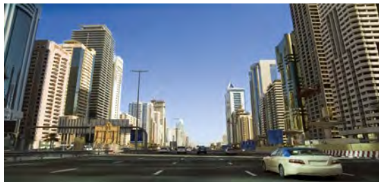
Angolo di visione / View angle 170°